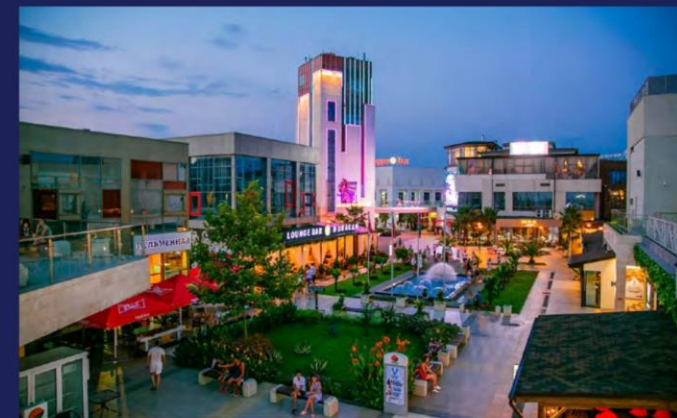
Торговый центр «Мандарин»